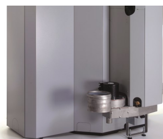
Sortie de fumée verticale pour plus de compacité